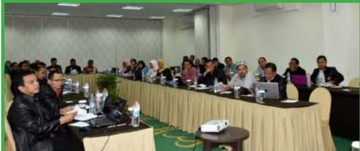
Workshop Percepatan Studi BS Kemenag 2016 - Bogor, 7-8 Mei 2017